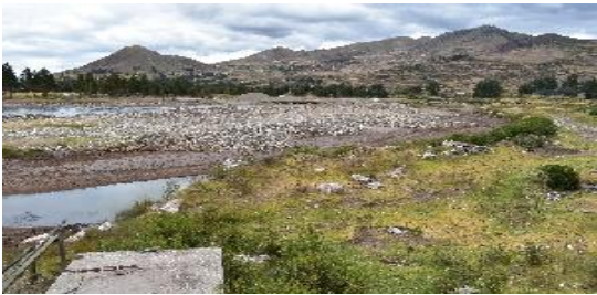
FOTO 03: Se aprecia el curso del agua por la margen izquierda afectado la ribera con erosion y proximo a la infraestructura de la linea ferrea