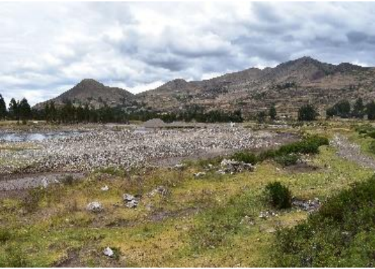
FOTO 01: Se aprecia el cauce del río Vilcanota colmatado, afectando a lalmargen izquirdade la ribera y así mismo se aprecia con talud natural afectado por erosión y colapzo en tramos