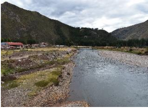
FOTO 02: Se aprecia la afectacion de la ribera margen izquierda aguas abajo del río Vilcanota.